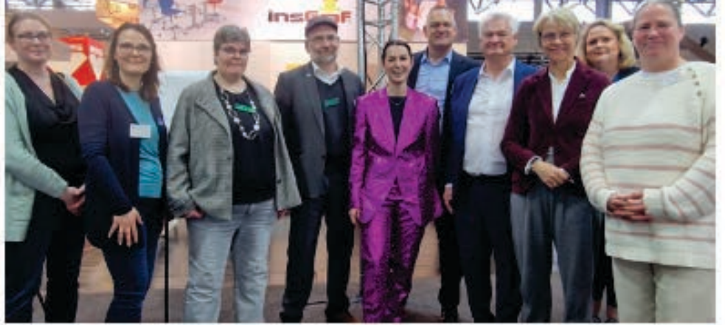
Schulministerin Dorothee Feller besuchte den Stand der LE Gymnasien NRW und der LE Realschulen NRW.