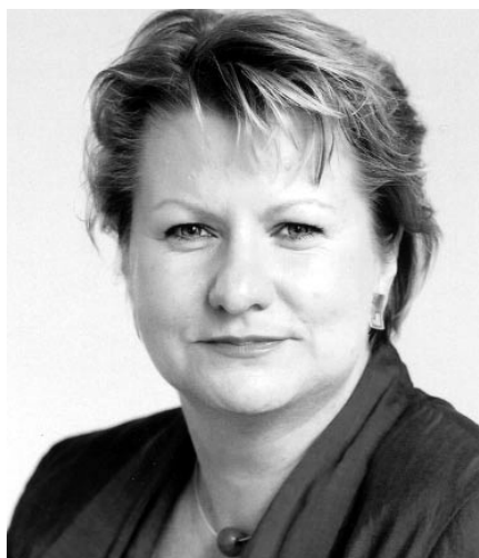
Sylvia Löhrmann, Bündnis 90/ Die Grünen

wiederholungen und Abschlungen. Jede institutionelle Barriere in einem Bildungssystem behindert aber – so die PISA-Experten – Lernen und Leistung. Deshalb wollen wir, dass die Schülerinnen und Schüler nach der vierten Klasse nicht auf unterschiedliche Schulformen aufgeteilt werden und dann im Gleichschritt durch das